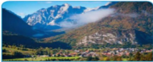
V dolini, ob vznožju gora, je vas Mojstrana.