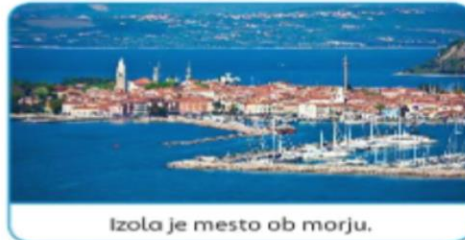
Izola je mesto ob morju.

Ljudje se prilagajamo okolju, v katerem živimo. Zgradili smo hiše, nove ceste, mostove. Ogradili smo pašnike, zorali njive in polja. Življenje ljudi v različnih pokrajinah se razlikuje. Tako se na primer ljudje, ki živijo ob morju, pogosto ukvarjajo z ribolovom in s turizmom. V gričevnatem svetu so ljudje na sončnih legah nasadili trte in se ukvarjajo z vinogradništvom.